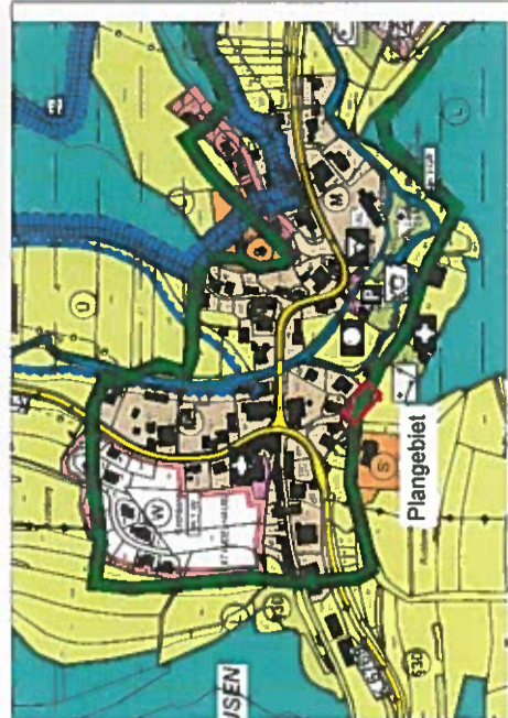
Ausschnitt Flächennutzungsplan ummaßstäblich