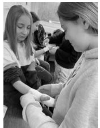
So verrutscht auch an der Hand ein Verband nicht