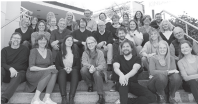
Vokalensemble Tübingen