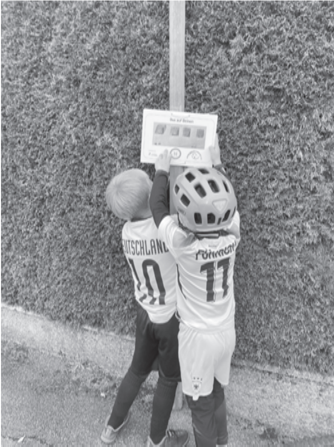
Foto: Zwei Schulkinder heften ein „Haltestellenschild“ an.