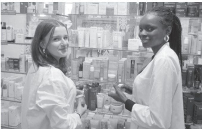
Foto: Jobben in der Apotheke.