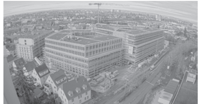
Luftaufnahme des Landratsamtsneubaus

Neben der Idealisierung der Baulogistik mit kurzen Transportwegen, hat dies zum Ziel, die regionale Wirtschaft zu stärken und im späteren Betrieb die Wartung verschiedenster Anlagen mit diesen regionalen Partnern wirtschaftlich abzuwickeln.